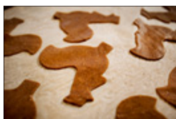
Pepparkakor – vackra och goda.